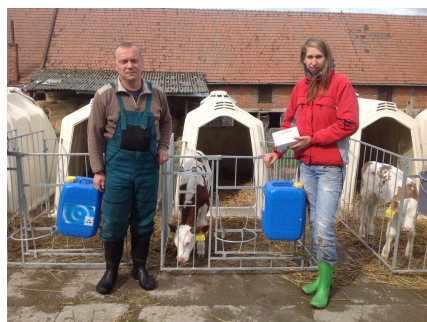
Ve spolupráci: MVDr. J. Musil